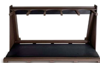
18-A 樹脂製バッグ立て 1878×483×939Hmm 樹脂製 色:緑、茶、黒 重厚感のある5本立てのクラブバッグ立てが登場いたしました。樹脂性なので耐久性も高く、落ち着いた空間を演出いたします。