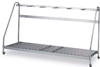
20-A ステンレスバッグ立て 1800×460×900mm ステンレス製 6本立て キャスター付