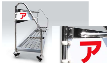
20-A-1 ステンレスバッグ立て(20A)用表示板 130×200×270mm アルミスチール複合板製 取付用 クランプ(合成皮革製)+ビス付き (20-A)ステンレスバッグ立てに付ける表示板です。可視性に優れた白の樹脂板にご指定の記号や文字の表示が可能です。現在お持ちのステンレスバッグ立てに簡単に装着できます。