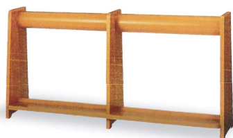
15-A 木製バッグ立て(6本立て) 1820×450×900mm(片面6本立て) 木製