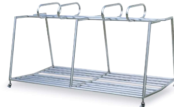
15-SAW ステンレスバッグ立て 1800×900×900mm ステンレス製 12本立て 両面タイプ フレーム部:25Φmm×1.5tmm ステンレス製 最低ロット3台