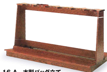
16-A 木製バッグ立て 1830×600×900mm 木製 両面12本立て 表面の色の変更は可能です。(価格変更なし)