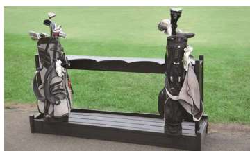
18 樹脂製バッグ立て 1700×430×810Hmm 樹脂製 色:緑、茶、黒 高級感があり、5本立てなので、ゆったりとクラブバッグを置くことができます。樹脂製で耐久性も高く、落ち着いた印象のバッグ立ては美しいゴルフ場を演出いたします。