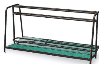
17-AW スチールパイプバッグ立て 1800×900×900mm スチール製 色:黒 底面:ゴム製 色:緑 両面アジャスト式