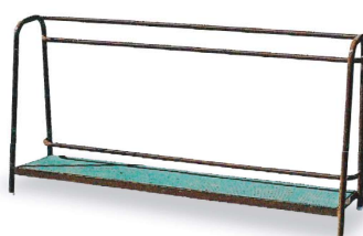
17-A スチールパイプバッグ立て 1800×450×900mm スチール製 色:黒 底面:ゴム製 色:緑 片面アジャスト式