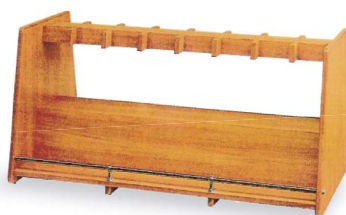
16 木製バッグ立て(16本立て) 1820×880×900mm(両面16本立て) 木製