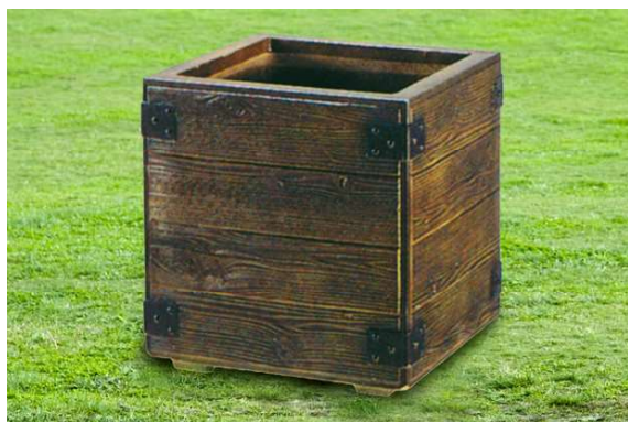
810-660 プランター(角型) 木目のもつ温かな質感を独自の技術で再現。 和洋どちらの空間も美しく引き立てます。