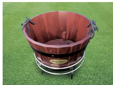
809-A ティグランド目砂箱 台付 330Φ×200mm アカシア材製 100mmステンレス製足、ステンレス台、スコップ付き