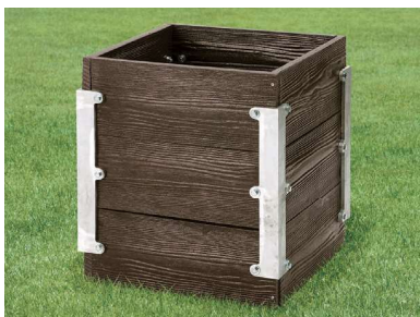
810-6 擬木目砂箱 520×520×600mm 擬木製 4ヶ所アルミ鋳物使用