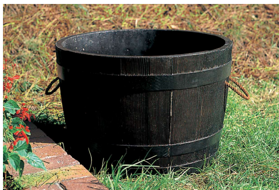
821-620 プランター(ビヤ樽型)