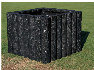
810-4 擬木目砂箱 700×700×500mm 擬木製