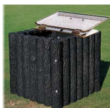
810-4A 目砂箱アルミ蓋 700×700×50mm アルミ製 取っ手付 810-4用蓋