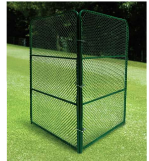
862 ホアキャディ2 高さ2000×幅1200mm×2枚 スチール製(取付金具付) 飛球防止ネットとして、2枚のネットを使用することで前方を含め左右からの飛球も防ぐことができます。折り畳むことで容易に移動することができ、キャディ用のみならず管理作業にも大変便利です。事故防止の為に安全性が配慮されたネットです。

大規模な防球ネットの施工も承っております。 北海道から沖縄まで全国を網羅し、アフターケアも完備しております。