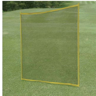
851 セーフティネット 1800×2000mm ポリエチレン製 専用ケース付 飛球防止ネットに新しいタイプの商品が登場しました。折りたたんで専用ケースに収納出来、軽く持ち運びも簡単です。1800×2000mmのサイズですので複数人の作業にも最適です。