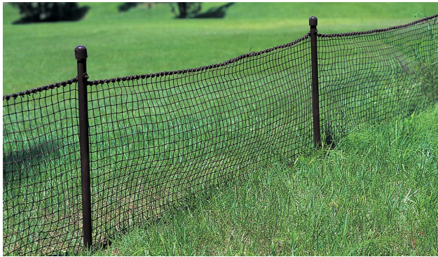
986 落球防止ネット ネット:1.2×50m 化繊製 色:茶 ポール:25.4φ×1500mm スチール製 色:茶 16本入 キャップ:26φmm 樹脂製 色:茶 16個入 ネット取付フック16セット付

大規模な防球ネットの施工も承っております。 北海道から沖縄まで全国を網羅し、アフターケアも完備しております。