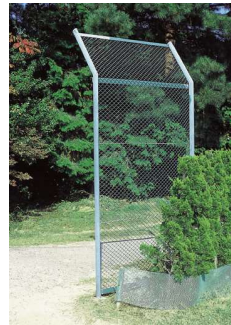
861 ホアキャディ1 2100×1200mm スチール製