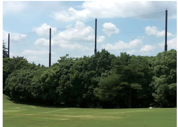
987 防球ネット (1)ポール S-JOY:現在最も使われている最新式のジョイント型炭素鋼鋼管 (2)ネット ベクトランネット:最新のスーパー繊維合成樹脂 ベクトラン製