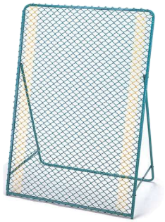
850 ガードネット 1300×900mm スチール製(フレーム鉄パイプ)