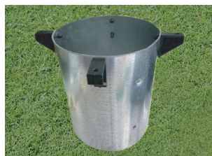
646-A アンカーパイプ 127Φ×150mm スチール製