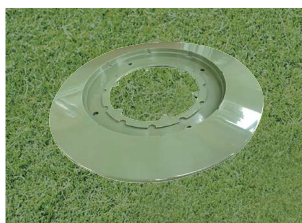
646-C カラー 270Φmm 樹脂製 色:赤、白、青、緑