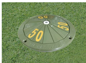
646-CT トップ 185Φmm 樹脂製 色:赤、白、青、緑