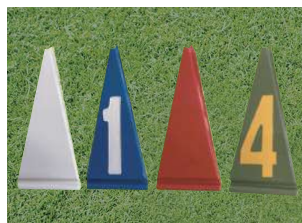
646-R リーフ 65×28mm 樹脂製 色:赤、白、青、緑 ※0~9の数字からお選びいただけます。