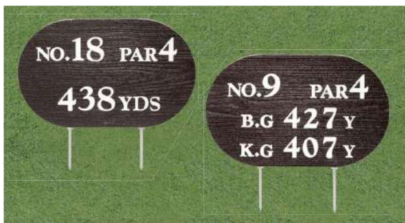
440-A-1 擬木木目ヤード板 ワングリーン表示 300×490×30mm 250mmステンレス製足