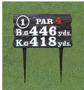
451-2 アルミ製木目ヤード板 ツーグリーン用 290×510×7tmm アルミ製 足 290mm アルミ製 凸表示