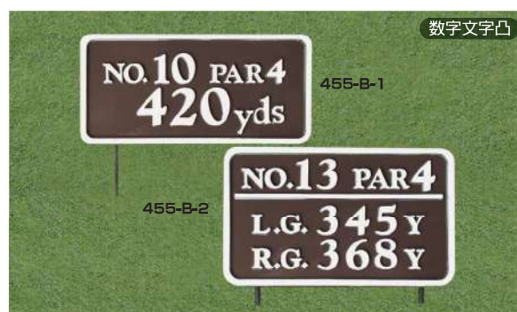
455-B-1 ヤード板 ワングリーン表示 200×400×15tmm 凸表示 250mmステンレス製足 455-B-2 ヤード板 ツァーグリーン表示 250×400×15tmm 凸表示 250mmステンレス製足