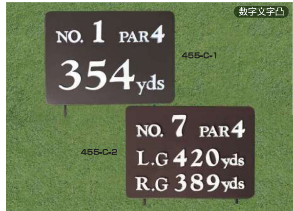
455-C-1 ヤード板 ワングリーン表示 300×400×15tmm 凸表示 250mmステンレス製足 455-C-2 ヤード板 ツーグリーン表示 300×400×15tmm 凸表示 250mmステンレス製足