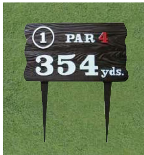
451 アルミ製木目ヤード板 ワングリーン用 290×510×7tmm アルミ製 足 290mm アルミ製 凸表示