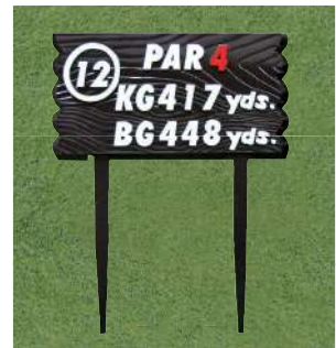
452-2 アルミ製木目ヤード板 ツーグリーン用 340×590×7tmm アルミ製 足 410mm アルミ製 凸表示