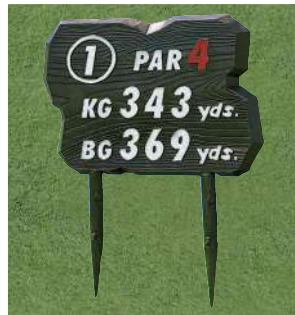
454-2 アルミ製木目ヤード板 ツーグリーン用 480×600×30tmm アルミ製 足 410mm アルミ製 凸表示