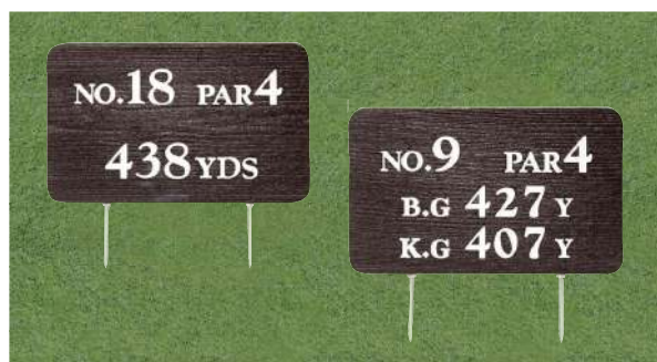
440-D-1 擬木木目ヤード板 ワングリーン表示 300×490×30mm 250mmステンレス製足