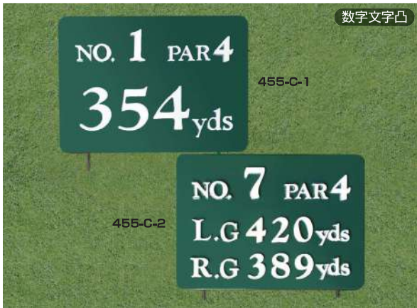
455-C-1 ヤード板 ワングリーン表示 300×400×15tmm 凸表示 250mmステンレス製足 455-C-2 ヤード板 ツーグリーン表示 300×400×15tmm 凸表示 250mmステンレス製足