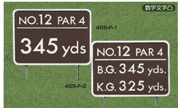
455-F-1 ヤード板 ワングリーン表示 300×400×15tmm 凸表示 250mmステンレス製足 455-F-2 ヤード板 ツーグリーン表示 300×400×15tmm 凸表示 250mmステンレス製足