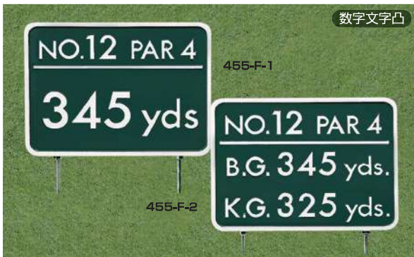
455-F-1 ヤード板 ワングリーン表示 300×400×15tmm 凸表示 250mmステンレス製足 455-F-2 ヤード板 ツーグリーン表示 300×400×15tmm 凸表示 250mmステンレス製足