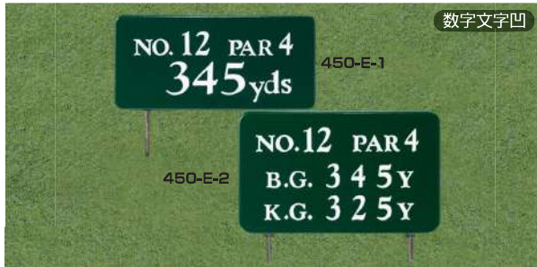
450-E-1 ヤード板 ワングリーン表示 200×400×18tmm 凹表示 250mmステンレス製足 450-E-2 ヤード板 ツーグリーン表示 250×400×18tmm 凹表示 250mmステンレス製足