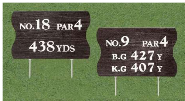
440-B-1 擬木木目ヤード板 ワングリーン表示 300×490×30mm 250mmステンレス製足