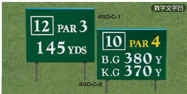
450-C-1 ヤード板 ワングリーン表示 300×400×18tmm 凹表示 250mmステンレス製足 450-C-2 ヤード板 ツーグリーン表示 300×400×18tmm 凹表示 250mmステンレス製足