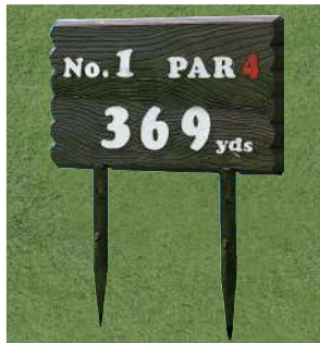
454 アルミ製木目ヤード板 ワングリーン用 450×640×30tmm アルミ製 足 410mm アルミ製 凸表示