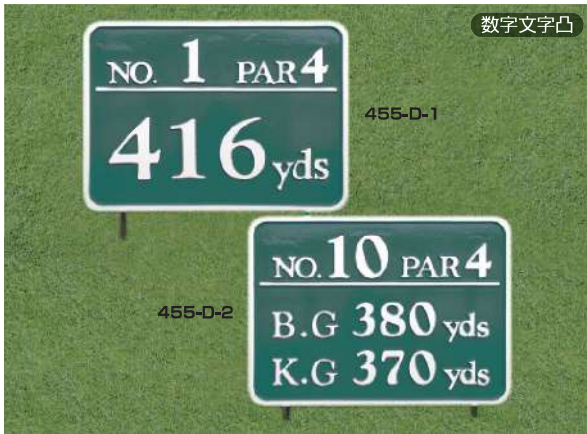
455-D-1 ヤード板 ワングリーン表示 300×400×15tmm 凸表示 250mmステンレス製足 455-D-2 ヤード板 ツーグリーン表示 300×400×15tmm 凸表示 250mmステンレス製足