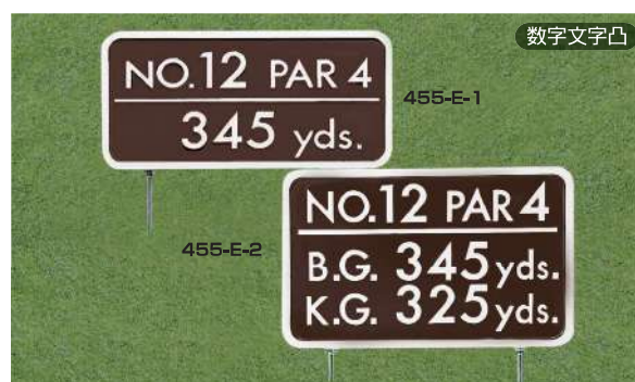
455-E-1 ヤード板 ワングリーン表示 200×400×15tmm 凸表示 250mmステンレス製足 455-E-2 ヤード板 ツァーグリーン表示 250×400×15tmm 凸表示 250mmステンレス製足