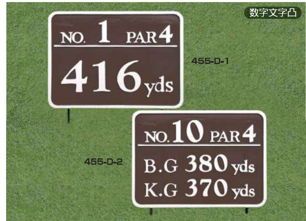
455-D-1 ヤード板 ワングリーン表示 300×400×15tmm 凸表示 250mmステンレス製足 455-D-2 ヤード板 ツーグリーン表示 300×400×15tmm 凸表示 250mmステンレス製足