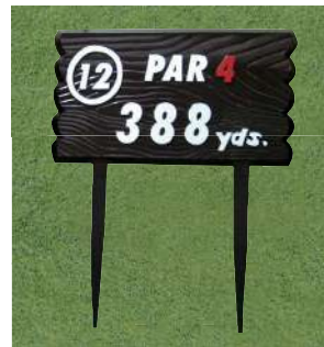
452 アルミ製木目ヤード板 ワングリーン用 340×590×7tmm アルミ製 足 410mm アルミ製 凸表示