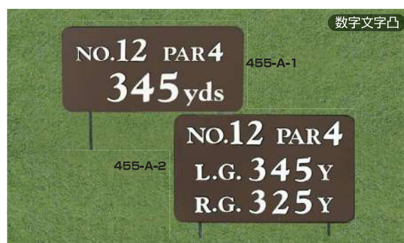
455-A-1 ヤード板 ワングリーン表示 200×400×15tmm 凸表示 250mmステンレス製足 455-A-2 ヤード板 ツァーグリーン表示 250×400×15tmm 凸表示 250mmステンレス製足