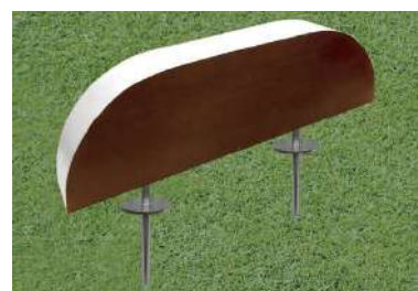
194 木製レッドシダーティーマーク ロングアーチ型 500×70t×150Hmm レッドシダー製 130mmステンレス製つば付足 色:赤、白、青、黄、金、銀、黒、ピンク 1ロット18個