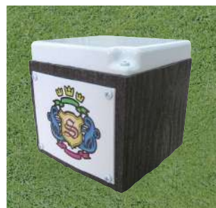
198 イベント用ティマーク 130×130×130Hmm プレート:アルミ製 本体擬木製 100mmステンレス製足2本 アルミベース付 色:赤、白、青、黄、金、銀、黒、ピンク(クラブマーク代別) 最低受注数:4個