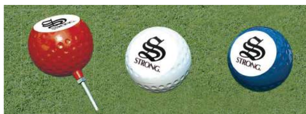
152-A 150型斜切ティマーク(マーク入り) 150Φmmアルミ製 150mmステンレス製足 色:赤、白、青、黄、金、銀、黒、ピンク(クラブマーク代別)