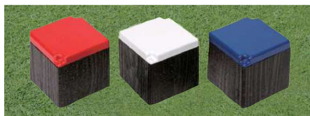
177 擬木ティマーク キュービクティマーク 130×130×130Hmm プレート:アルミ製 本体擬木製 50mmステンレス製足 アルミベース付 色:赤、白、青、黄、金、銀、黒、ピンク