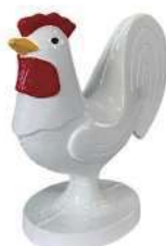
266-E 動物型ティマーク ニワトリ 190×70×240Hmm アルミ製 100mmステンレス製足