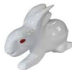
266-F 動物型ティマーク ウサギ 190×50×70Hmm アルミ製 100mmステンレス製足2本付