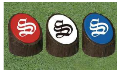
176 擬木ティマーク 150Φ×65×160Hmm プレート:アルミ製 本体擬木製 50mmステンレス製足 アルミベース付 色:赤、白、青、黄、金、銀、黒、ピンク(クラブマーク代別)