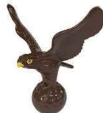
266-C 動物型ティマーク タカ 180×240×260Hmm アルミ製 150mmステンレス製足