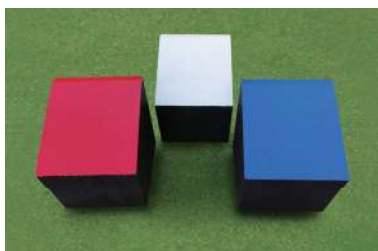
187 木製ヒノキティーマーク 角型 110×110×130Hmm ヒノキ製 50mm ステンレス製アルミベース付足 色:赤、白、青、黄、金、黒、ピンク