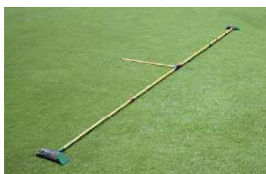
195 ティーマーク設置ゲージ 収納寸法1387.5mm 最大引伸6,020mm ガラスファイバー製 重量1.2kg