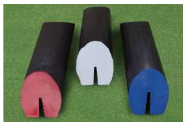
188 木製杉ティーマーク ブランチ型 250×70×60Hmm 北山杉製 100mm ステンレス製足2本付 色:赤、白、青、黄、金、黒、ピンク