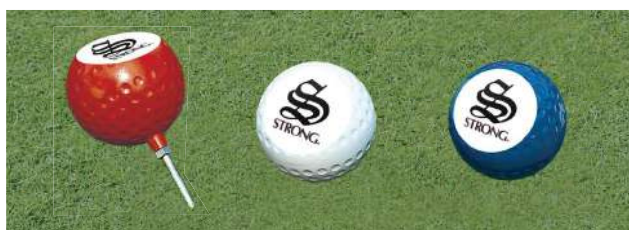
135 130型斜切ティマーク(マーク入り) 130Φmm アルミ製 100mmステンレス製足 色:赤、白、青、黄、金、銀、黒、ピンク(クラブマーク代別)