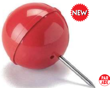
103 球形プラスチック製ティマーク 100Φmm プラスチック製 足:60mm ステンレス製 色:赤、白、青、黄、黒 プラスチック製のティマークが登場しました。ツーピースの溶接によりつなぎ合わせた構造でステンレス製のスパイク足が取り付けられています。