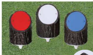
176-B 擬木ティマーク 100Φ×60×125Hmm プレート:ABS樹脂製 本体擬木製 50mmステンレス製足 アルミベース付 色:赤、白、青、黄、金、銀、黒、ピンク