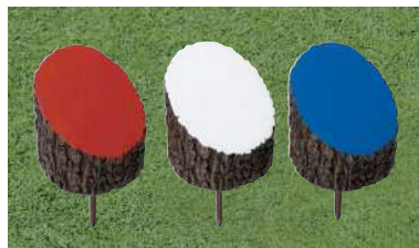
179 擬木ティマーク 110Φ×45×110Hmm 擬木製 50mmステンレス製足 色:赤、白、青、黄、金、黒、ピンク