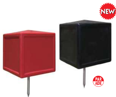
183 イベントティマーク4面表示 無地 130×130×130mm 樹脂製 足:80mm ステンレス製 色:赤、黒

イベント用のティマークが登場しました。4面にはお好きなシートを貼り付けることができるため、スポンサー様やイベント主催者様のご希望に沿ったデザインで使用することができます。