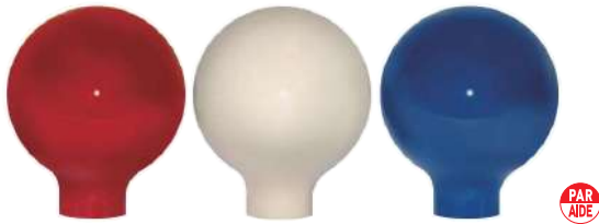
102-D 100型フォーエバーティマークネックタイプ 100Φmm 樹脂製 110mmステンレス製足 色:赤、白、青、黄、黒、緑、オレンジ、金、灰色