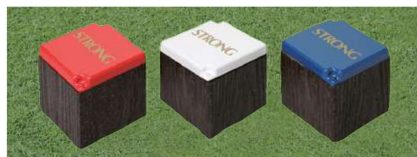
177-A 擬木ティマーク マーク付 130×130×130Hmm プレート:アルミ製 本体擬木製 50mmステンレス製足 アルミベース付 色:赤、白、青、黄、金、銀、黒、ピンク(クラブマーク代別)