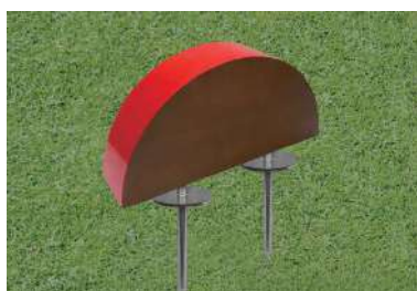
193 木製レッドシダーティーマーク 半円型 300×70t×150Hmm レッドシダー製 130mmステンレス製つば付足 色:赤、白、青、黄、金、銀、黒、ピンク 1ロット18個

丈夫で耐久性の高い米杉の特徴と自然な木の風合いを備え、とても落ち着いた上質なティーマークです。