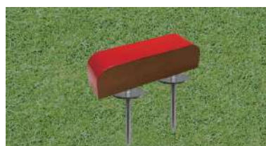
194-A 木製レッドシダーティーマーク ロングアーチ型小 250×70t×70Hmm レッドシダー製 130mmステンレス製つば付足 色:赤、白、青、黄、金、銀、黒、ピンク 1ロット18個