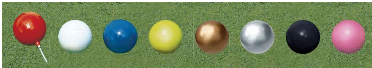
131 130型ティマーク 130Φmm アルミ製 100mmステンレス製足 色:赤、白、青、黄、金、銀、黒、ピンク