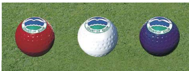
152 150ボール型ティマーク(マーク入り) 150Φmm アルミ製 150mmステンレス製足 色:赤、白、青、黄、金、銀、黒、ピンク(クラブマーク代別)