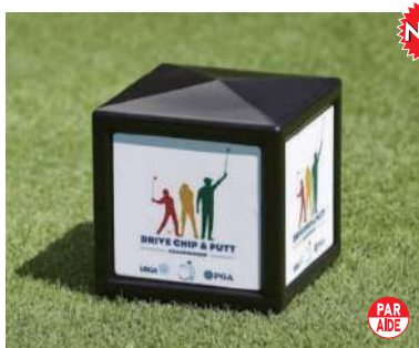
183-A イベントティマーク4面表示 マーク入 130×130×130mm 樹脂製 足:80mm ステンレス製 色:赤、黒 1ロット20個