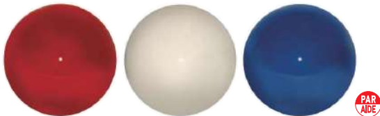
102-C 100型フォーエバーティマーク 100Φmm 樹脂製 110mmステンレス製足 色:赤、白、青、黄、黒、緑、オレンジ、金、灰色