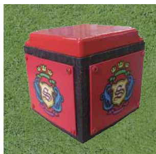
199 イベント用ティマーク 130×130×130Hmm プレート:アルミ製 本体擬木製 100mmステンレス製足2本 アルミベース付 色:赤、白、青、黄、金、銀、黒、ピンク(クラブマーク代別) 最低受注数:4個