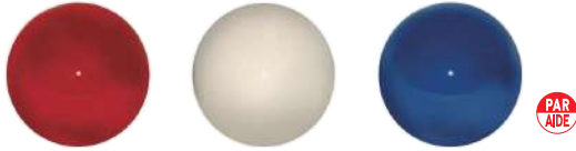
102-A 80型フォーエバーティマーク 80Φmm 樹脂製 110mmステンレス製足 色:赤、白、青、黄、黒、緑、オレンジ、金、灰色

特別な樹脂により鏡面仕上げの美しい表面と耐久性を実現しました。美しいティーイングエリアの雰囲気をより一層引き立てるティマークです。80Φmmと100Φmmサイズにオリジナルマーク入れることができます。