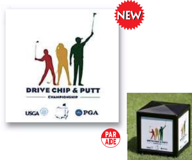
183-A-1 イベントティマーク用 プリントシート 100×100mm 塩化ビニール製 1ロット80枚