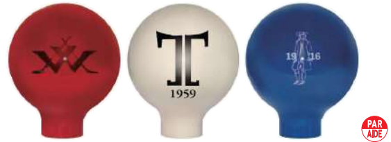
102-D-A 100型フォーエバーティマークネックタイプ マーク入 100Φmm 樹脂製 110mmステンレス製足 色:赤、白、青、黄、黒、緑、オレンジ、金、灰色