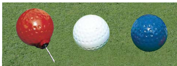
151 150ボール型ティマーク 150Φmm アルミ製 150mm ステンレス製足 色:赤、白、青、黄、金、銀、黒、ピンク