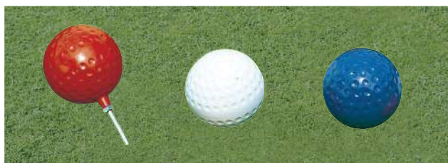
133 130ボール型ティマーク 130Φmm アルミ製 100mmステンレス製足 色:赤、白、青、黄、金、銀、黒、ピンク