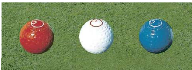
132 130ボール型ティマーク(マーク入り) 130Φmm アルミ製 100mmステンレス製足 色:赤、白、青、黄、金、銀、黒、ピンク(クラブマーク代別)