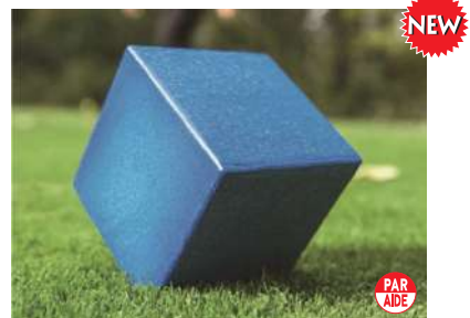
104 キューブ型ティマーク 100×100mm 再生プラスチック製 足:65mm ステンレス製 色:赤、白、青、黄、緑、黒 再生プラスチック製のティマークが登場しました。10cm四方の正六面体で、スパイク足は面と面の接点に取り付けられており、美しいティグランドを演出致します。また、ツヤなしの色合いなので、自然にマッチします。