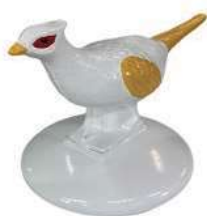
266-D 動物型ティマーク キジ 360×200×220Hmm アルミ製 100mmステンレス製足3本付