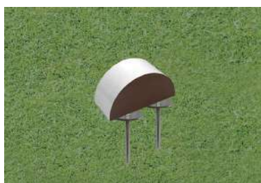
193-A 木製レッドシダーティーマーク 半円型小 150×70t×75Hmm レッドシダー製 130mmステンレス製つば付足 色:赤、白、青、黄、金、銀、黒、ピンク 1ロット18個