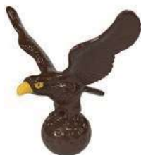
266-B 動物型ティマーク ワシ 170×230×270Hmm アルミ製 150mmステンレス製足