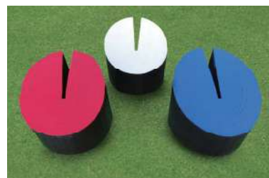
189 木製杉ティーマーク スタンプ型 120Φ×55×115Hmm 北山杉製 50mm ステンレス製アルミベース付足 色:赤、白、青、黄、金、黒、ピンク