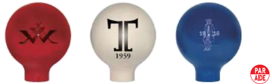
102-B-A 80型フォーエバーティマークネックタイプ マーク入 80Φmm 樹脂製 110mmステンレス製足 色:赤、白、青、黄、黒、緑、オレンジ、金、灰色