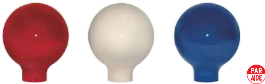
102-B 80型フォーエバーティマークネックタイプ 80Φmm 樹脂製 110mmステンレス製足 色:赤、白、青、黄、黒、緑、オレンジ、金、灰色