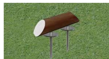
197 木製レッドシダーティーマーク ブランチ型 250×60t×70Hmm レッドシダー製 130mmステンレス製つば付足 色:赤、白、青、黄、金、銀、黒、ピンク 1ロット18個