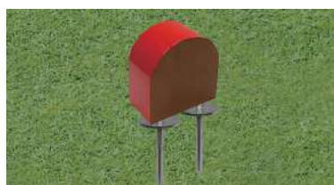
196 木製レッドシダーティーマーク アーチ型 130×70t×130Hmm レッドシダー製 130mmステンレス製つば付足 色:赤、白、青、黄、金、銀、黒、ピンク 1ロット18個