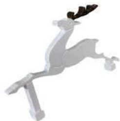
266-A 動物型ティマーク シカ 230×10×160Hmm アルミ製 100mmステンレス製足2本付

動物型ティマークです。御希望の色に塗り替えることも可能です。 ご要望に応じて、別途見積にて、オリジナルの動物型ティマークを作成させていただきます。