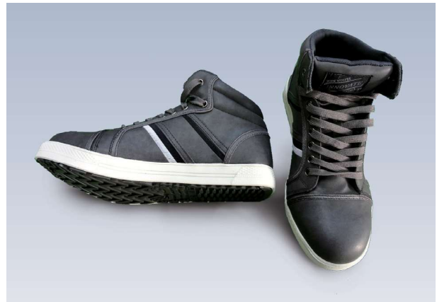
表:合成皮革製 内側:ナイロンメッシュ製 色:黒、青 世界最高水準の防水・透湿素材を採用樹脂製先芯の軽量仕様の為、履き心地抜群です。耐油性ゴム底仕様なので履く場所を選びません。