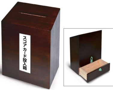
47 スコアカード投入箱 150×250×350mm 木製