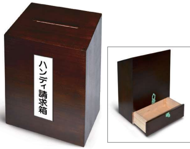
45 ハンディ請求箱 150×250×350mm 木製