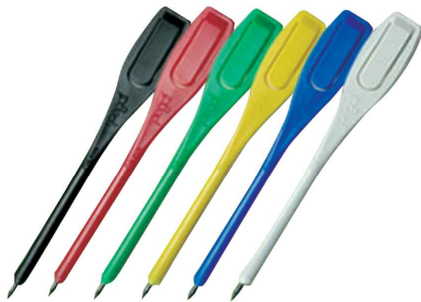
53 ペグシル 本体:15×110mmポリスチレン製 色:黒、赤、緑、黄、青、白 1ロット30,000本 ネーム入り別途見積もり承ります。