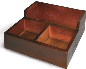
48 鉛筆カードマーク入れ 180×230×98mm 木製