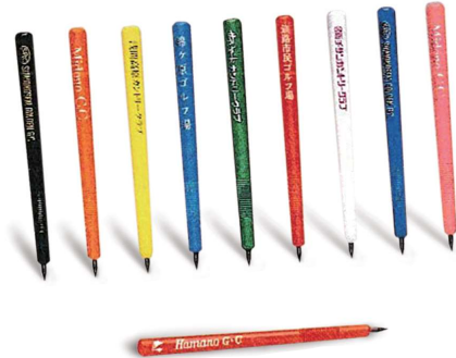
54 ジーベンシル 本体:7.5×97mmポリスチレン製 色:黒、オレンジ、黄、青、緑、赤、白、ネイビー、ピンク 1ロット30,000本 ネーム入り別途見積もり承ります。