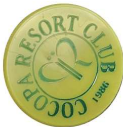
720 グリーンマーク 22φ×14mm ポリスチレン製 色:白、レモンイエロー、黄、ピンク、オレンジ、赤、サックス、青 マーク入り、ロット20,000個