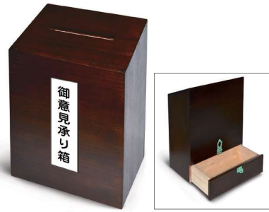
46 御意見承り箱 150×250×350mm 木製