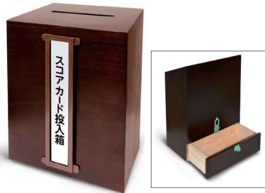
47-A 競技用スコアカード投入箱 150×250×350mm 木製 月例等各競技用プレート 取換え可