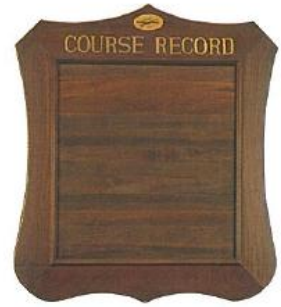
2 チャンピオンボード 910L×800W