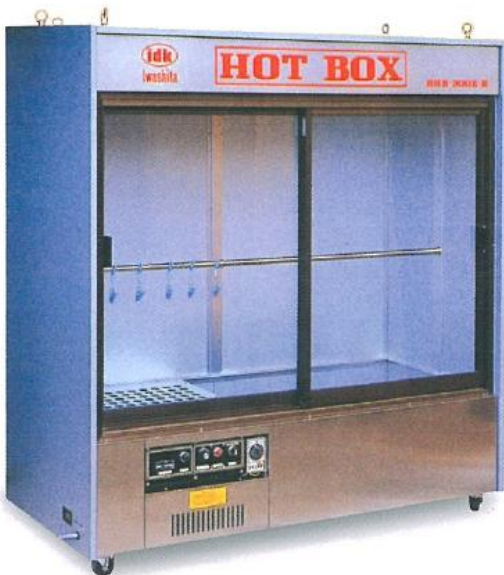
96 HOT BOX 強力熱風式乾燥機 BHB-300E-B<電気式>

形 式: BHB-300E-B<電気式> 電 源: 三相200V,5kW,20A 外 形 寸 法: 1800×780×2000mm 重 量: 270kg 着 数: 50~60着