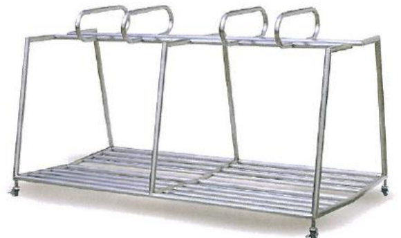
15-SAW ステンレスバッグ立て 12本立 1800L×900W×900H 両面タイプ フレーム部:SUS304 1.5mmφ 25mmφ 受注は3台より