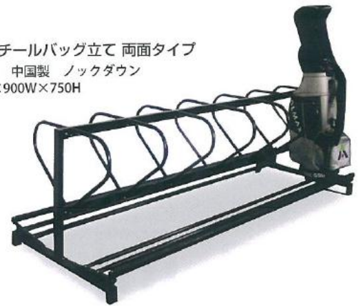
18 スチールバッグ立て 両面タイプ 12本立 中国製 ノックダウン 2200L×900W×750H