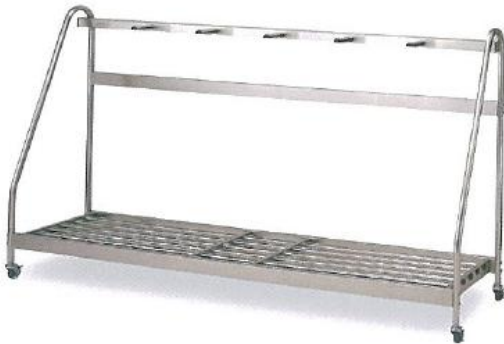
20-A ステンレスバッグ立て 6本立 中国製 ノックダウン 1800L×460W×900H