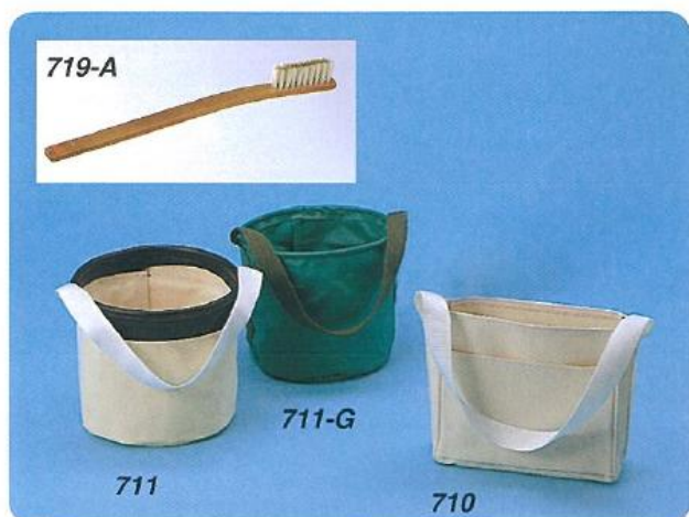
711 丸型砂袋 170×200φ帆布製 711-G グリーン砂袋 170×200φ 710 砂袋 210W×170L×70T帆布製