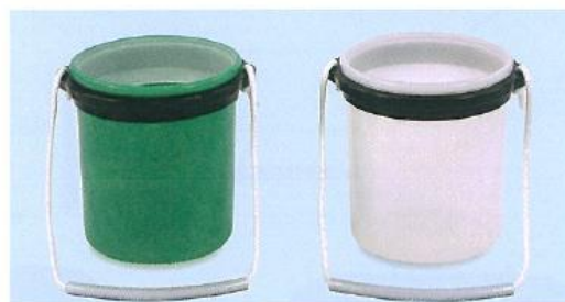
711-B クラブ洗い水バケツ 水はね防止蓋付 グリーン 175φ×190H 711-C クラブ洗い水バケツ 水はね防止蓋付 透明 175φ×190H