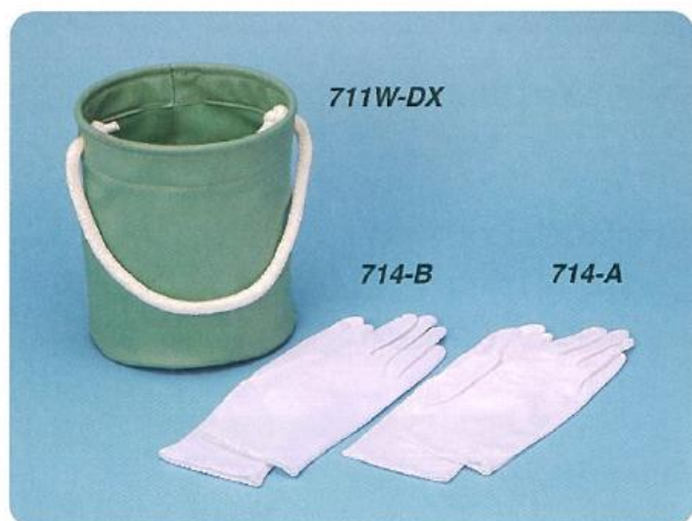
711W-DX 水袋 180φ×190mmH