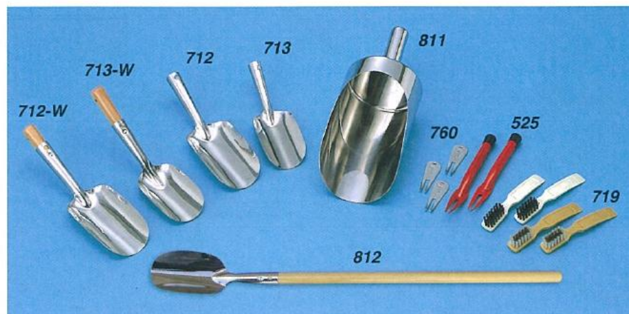
712-W 柄付スコップ(大) 713-W 柄付スコップ(中) 712 スコップ(大) 713 スコップ(中) 811 万能スコップ (110φ×169 柄110mm) 1.0φ 760 グリーンホーク ベントグリーン修正用 525 グリーンホーク(大) 719 ウッド・アイアン・ブラシ 2本セット 812 柄600付スコップ ステンレス 木製柄付