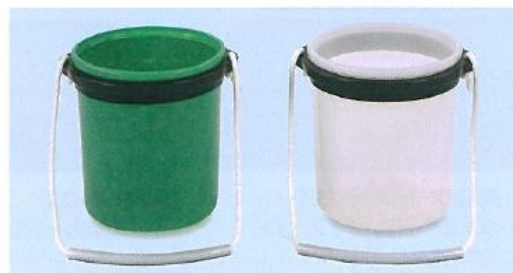
711-D クラブ洗い水バケツ 水はね防止蓋なし グリーン 175φ×190H 711-E クラブ洗い水バケツ 水はね防止蓋なし 透明 175φ×190H