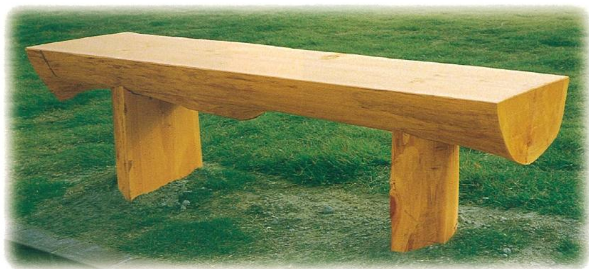
698-A 木曽ヒノキベンチ 1500L×300W×420H(750H) 698-B 木曽ヒノキベンチ(大) 1800L×300W×420H(750H)