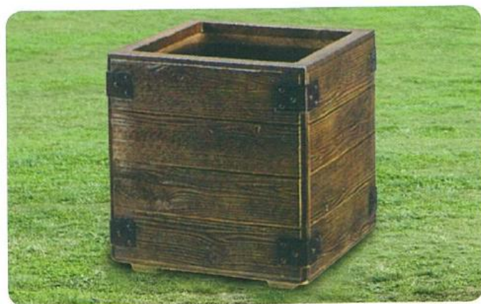
810-660 グレンウッディシリーズ

木目のもつ温かな質感を独自の技術で表現。 和洋どちらの空間も美しく引き立てます。