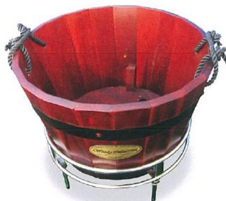
809-A ティグランド目砂箱 台付 アカシア材ステンレス台 スコップ付