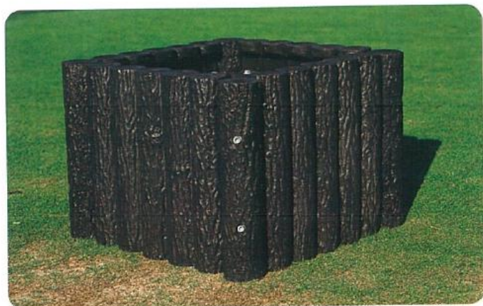
810-4 擬木目砂箱 700L×700W×500H (プラスチック製擬木)