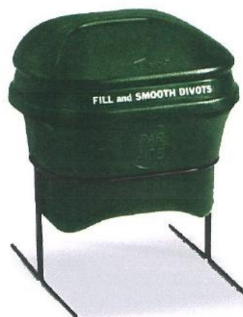
810-7 ディボットメイト ロースタンド 容量は約15ℓ