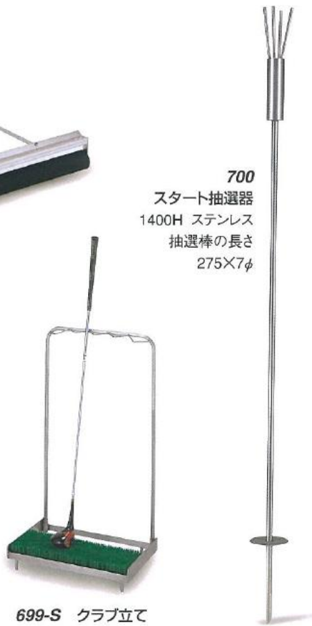
700 スタート抽選器 1400H ステンレス 抽選棒の長さ 275×7φ