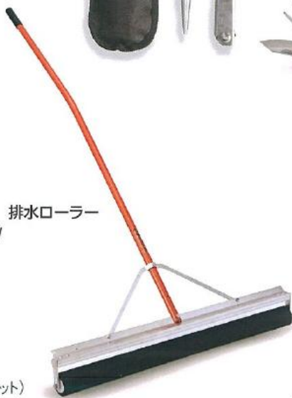
523 排水ローラー 900W