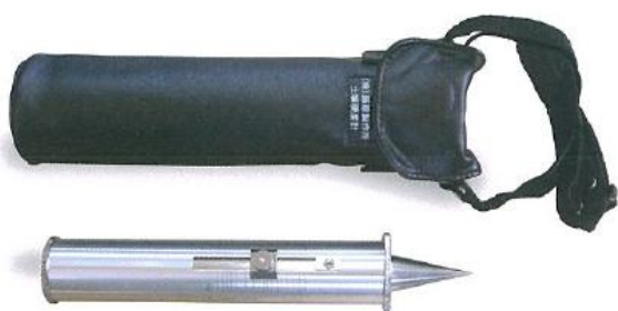
539 コンパクションメーター 山中式土壌硬度計 本硬度計の測定値が選手による評価は高い。 普通と評価される硬度は一般用で 22、 競技用で 24 と考えられる。