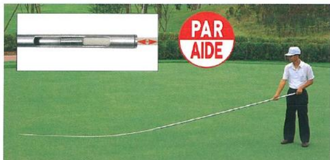
520 露払いボール 5000L (2500+2500) パーエイド社製