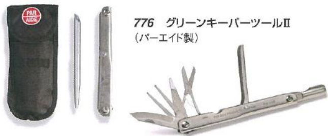
776 グリーンキーパーツールⅡ (パーエイド製)