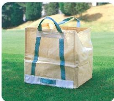
912 芝入袋 (10枚セット) 600×600×700 両サイド取手付 底面・全面ナイロン張り