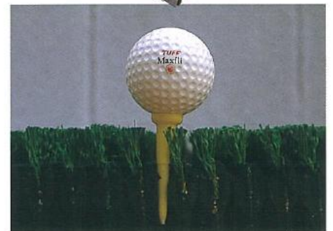
938-630 デビロン630 500×500