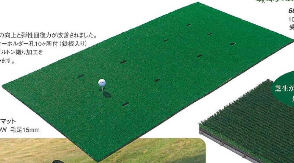
664 ティグランドマット 1800L×900W 毛足15mm