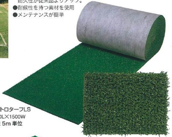
661 アストロターフLS 1000L×1500W 受注 5m単位