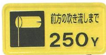
916-A ヤード標示板 200×400mm アルミ製 ユニクロメッキ脚付 (3/8"×300φ)