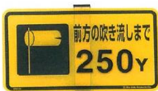
916-AP ヤード標示板 150×275mm 足400mm