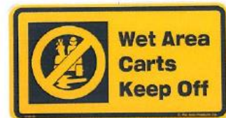
385 ウェットエリア カートキープオフ