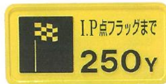
916-B ヤード標示板 200×400mm アルミ製 ユニクロメッキ脚付 (3/8"×300φ)