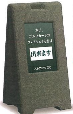
362 サインストーン グリーン 440×460×H870mm ポリスチレンフォーム+石材加工 ※製造の都合上、色彩・重量等に多少の違いがあります。