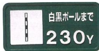
916-E ヤード標示板 200×400mm アルミ製 ユニクロメッキ脚付 (3/8"×300φ)