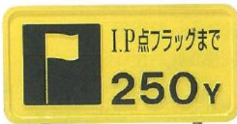
916-C ヤード標示板 200×400mm アルミ製 ユニクロメッキ脚付 (3/8"×300φ)