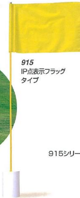
915 IP点表示フラッグ タイプ