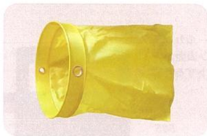
918-A 吹き流しのみ 260φ×500L 915-B、918用 新型