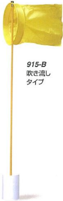
915-B 吹き流し タイプ