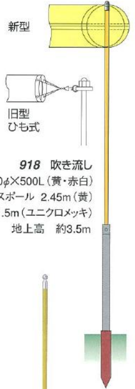
918 吹き流し 吹き流し 260φ×500L (黄・赤白) グラスポール 2.45m (黄) 埋込金具 1.5m (ユニクロメッキ) 地上高 約3.5m