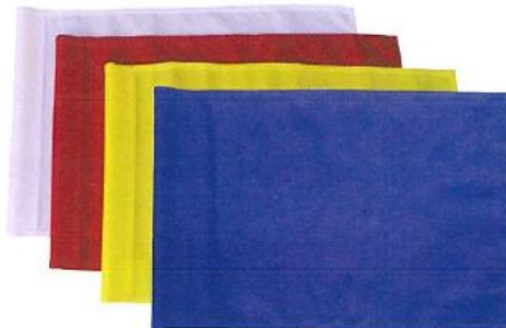
511-E 強化ナイロンフラッグ (チューブ付) 無地 915用フラッグ 340×500mm 白、赤、黄、青 MADE IN CHINA