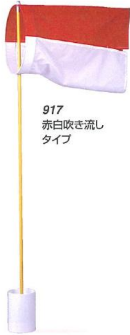
917 赤白吹き流し タイプ