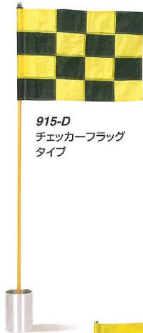
915-D チェッカーフラッグ タイプ