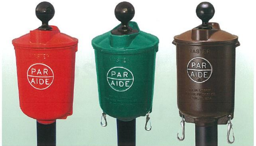
マスタータイプボール洗い(パーエイド製)