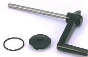
506-F パーツ ハンドル ドレンプラグ ガスケット

排水管が液位をクラック・シャフト以下に保ち、満たし過ぎや溢れを防止。雨や散水によって滴水になることを防ぎます。