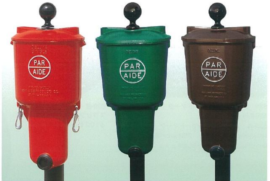
ボール洗いDX(パーエイド製)