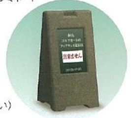
裏の表示(片面違い)