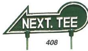
408 NEXT. TEE 150×400mm 300脚付