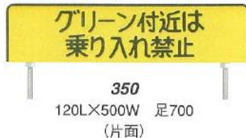
350 120L×500W 足700 (片面)