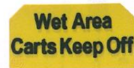
373 ウェットエリア カートキープオフ