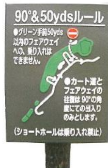
482 90° ルール 板 400×300 支柱 80φ×1500 mm