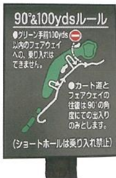
482-1 グリーン迄 100 ヤード 90° ルール 板 400×300 支柱 80φ×1500 mm