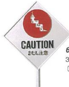
683 まむし注意 300L×300W×1500H脚 (アルミ鋳物)