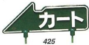
425 カート指示板(大) 150×400mm 300脚付 (全て両面表示となります。)