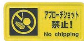
418-B アプローチ禁止板 200L×400mm ユニクロメッキ脚付(3/8"×300φ)

※赤一白、白一赤、茶一白の色の組合せは自由です。 ※多色(3色以上)は別途見積りとなります。