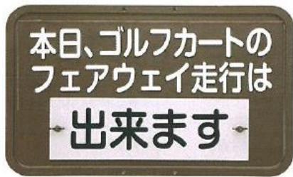
485 フェアウェイ走行・可・不可 表示板 表示部 300×500mm 80φ×1500mm 柱2本組 プレートは反転式