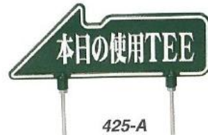
425-A 150×400mm 300脚付