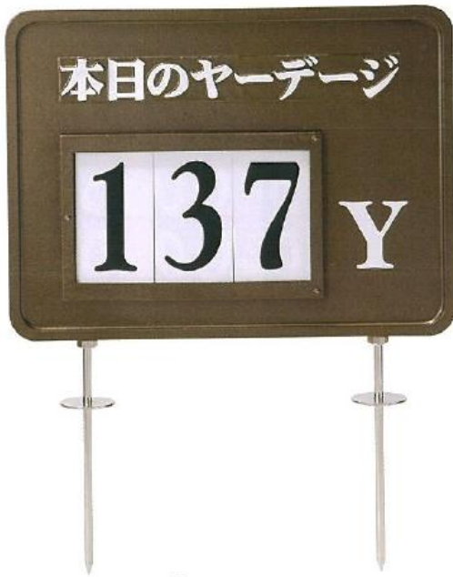
490 本日のヤーデージ板 300×400mm 予備数字プレート10枚付 基本のヤードが入った状態にて出荷です (スコアカードのヤード数) ※ティグラウンドからカップまでの距離を表示 数字プレートは3枚とも取りかえ可能