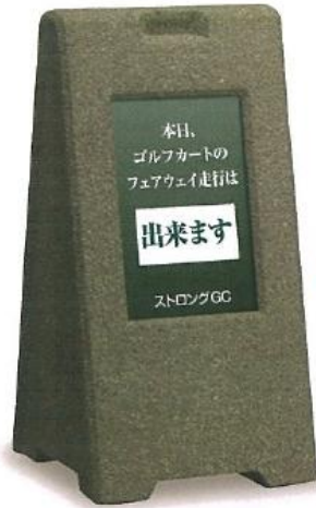
362 サインストン グリーン 440×460×H870mm ポリスチレンフォーム十石材加工 ※製造の都合上、色彩・重量等に多少の違いがあります。