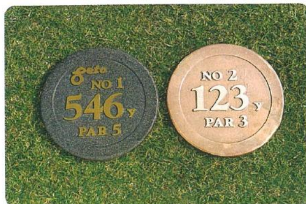
642 円型ヤードプラーク 300φ鉑金製 厚さ7mm ネーム別途