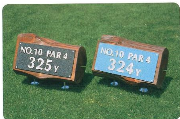
470-GA 木曾ヒノキアルミプラーク付 アルミプラーク165×360