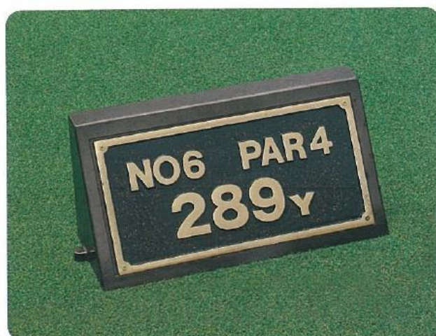
636-A ヤードプラーク(鉑金製) 凸文字 ガン・メタル 240L×440W×215H アルミ枠(鉑全部200L×400W)