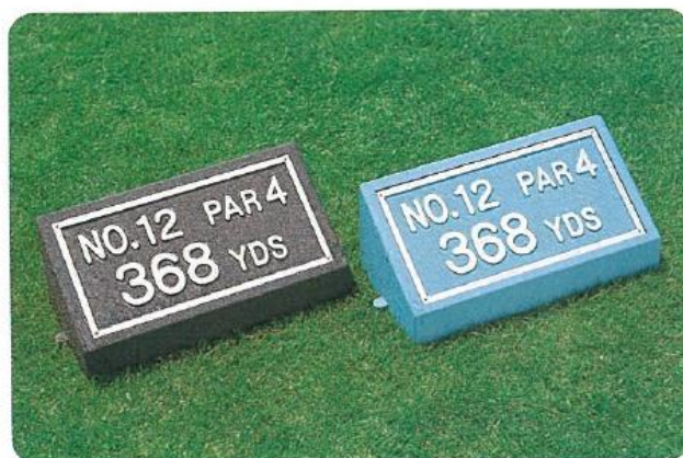
636-C-1 ヤードプラークアルミ 240L×440W×180H アルミ枠 アルミ200L×400W