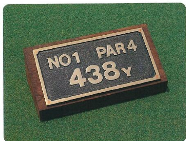
636 ヤードプラーク(鉑金製) 凸文字 ガン・メタル 240L×440W×180H 木製台(鉑全部200L×400W)